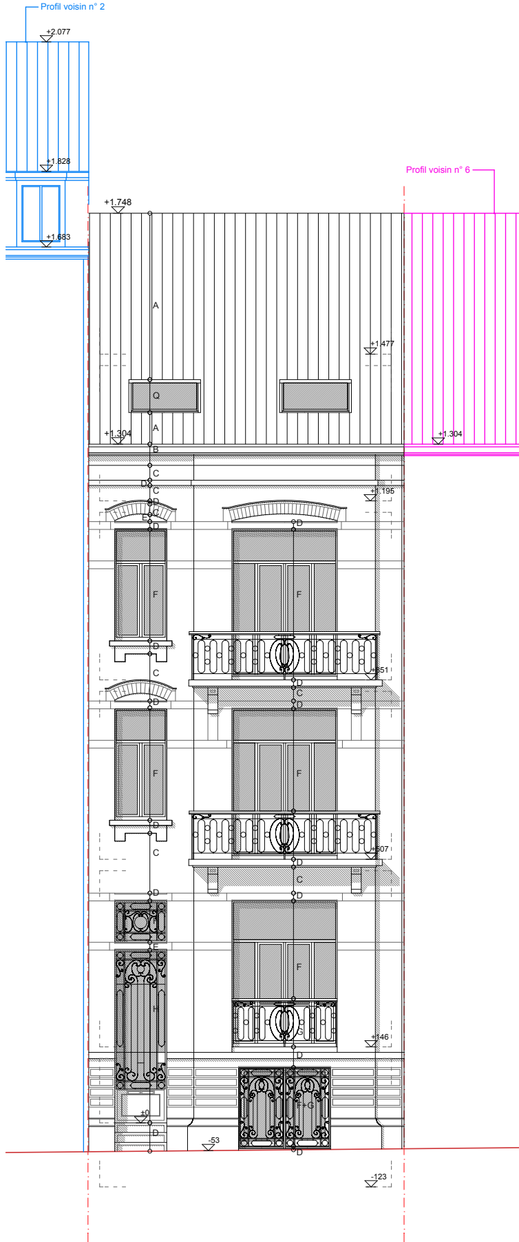
Façade à rue